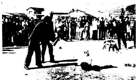
威力を發揮する消火器

3月定例市議会は、3月8日から同28日までの予定で開会中です。15日以降の日程は、16日(木)まで一般質問(13日から)、17日(金)、18日(土)は議案に対する質疑、20日(月)から25日(土)まで委員会ごとに議案審議、28日(火)に各委員長の審査報告、質疑、討論、採決が行われます。