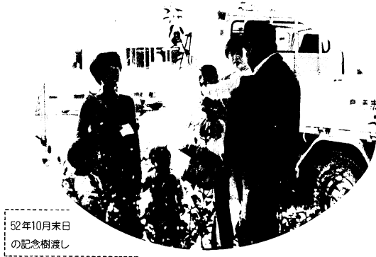
52年10月末日の記念樹渡し

結果は、枯れてしまったのが1本あっただけで全体的に生育は良くまずはひと安心。しかしもっと日当たりがよければとか、排水がよければというところもあるので、環境課では次の苗木配布からは、植付け方法を図示することにしています。調査対象の一部にカイガラ虫の付いたもの、肥料切れのものがあつたので、防除や施肥の助言もしました。