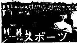
少年野球 曾根崎町Aが優勝

品種のはっきりした木 木によってはいろいろな品種があり、花の色や形の違ったものが多いので品種をよく確かめて。