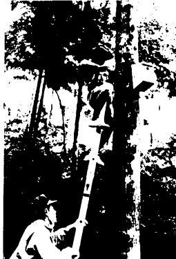
巣箱をかけるボーイスカウト

じゅうしまつが巣箱を使うのは3月から5月までですので、それ前に、巣箱の中に張ったクモの巣やゴミなどの清掃をするため、屋根を開けられるように作っています。来春には、たくさん