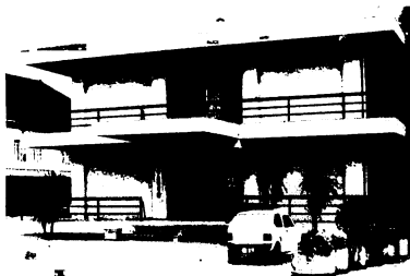
化粧直した市立図書館

6月の休館日 ・14日(第2水曜日)・28日(第4水曜日)・30日(月末整理日)