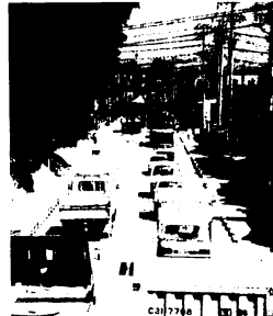
国道3号線、曾根崎町交差点付近

また昭和54年3月8日、9日、22日、23日には、曾根崎町交差点横で県の大気環境測定車による大気汚染調査を行う予定です。