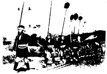
村田浮立(50年10月写す)