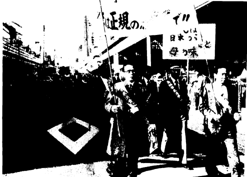
12月3日はバレットで米消費を呼びかけ

11月21日、農業団体、販売業者、消費グループ、婦人会、県、市など26団体で結成した鳥栖市米消費拡大推進連絡協議会(会長一原市長)は、12月1日からさっそく具体的なPR活動を行いました。 まず12月1日から5日まで、とす市の買物客をねらって、本通町一丁目のAコープ前に、おにぎりコーナーを設け無料でおにぎりをサービス。おふくろの味を再認識して…と呼びかけました。 使った米は約360俵(6俵)、約7500個