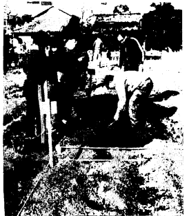
開園日に記念に配られたタマネギ苗を植える人たち

鳥栖基山農協生産対策室が水田利用再編対策の一つとして始めた「レクリエーション農園」は12月3日開園しました。宿町門戸口の農園66区画は全部申し込みがあり、開園日には記念に配られたタマネギ苗を植えつける家族づれもあり、農機具屋さんも店開きました。2、3の入園者にたずねたところ、花づくりが多いかなという予想に反し、野菜を作り出すという答えばかり。物価高の世相では「花よりダンゴ」というところでしょうか。豊かな収穫が楽しみです。