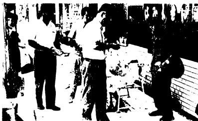
街頭でのチラシ配布

守りましょう」と広報車で呼びかける一方、「きびしさと、やさしさが育てる明るい子供」と書かれたチラシなどを配布し、市民の理解と協力を訴えました。夏休み中は特に、青少年の生活を市民みんなで見守って行きましょう。