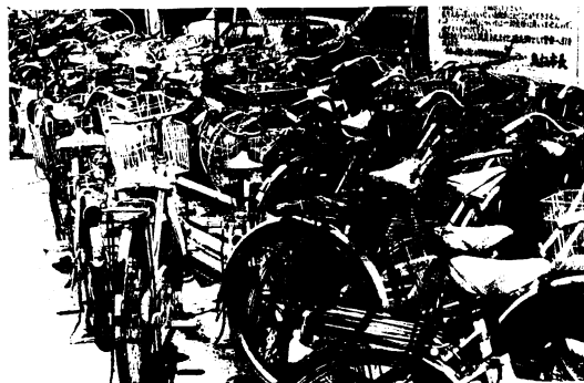
7月19日の鳥栖駅前自転車置場