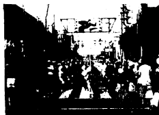
まつりとす“79パレード (歩行者天国)

鳥栖の夏まつりは、7月21・22日の鳥栖山笠 (主催山笠奉賛会) を皮切りに始まり、雨天のため25日に延期した市民花火大会 (主催鳥栖青年会議所) として、夏まつりの最後を飾るまつりとす“79 (主催まつりとす実行委員会) が29日に行われました。主催者の発表によると今年の夏まつりの入出は、8万人だったそうです。