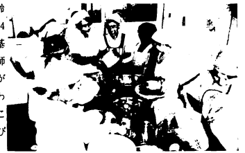
みそづくり講習会(農家高齢者創作館)

6月4日に開館した農家高齢者創作館(真木町)で、7月24日から27日まで4日間、三菱養業農業改良普及所から2人の講師を招き、農家の主婦30人ほどがおいしいみその作りかたを教わりました。講習の合間には、こんにゃくの作りかたなども学びました。