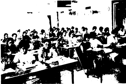
婦人教養講座の開講式