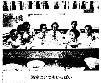
浴室はいつもいっぱい

現在月2回、健康相談を行っています。これからは、民謡教室なども行いたいと大島所長は話しています。