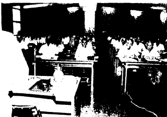
老人交通安全指導員研修会のもよう