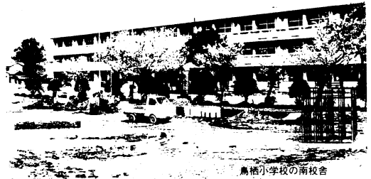
鳥栖小学校の南校舎