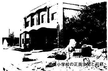
旭公民館の正面玄関と前庭