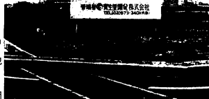
鳥栖商工団地内に立てられた看板