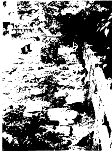
去年のゴールデン ウィークに朝日山で

それでもなお7000余りのゴミの山が全国の国立公園に集められるのです。このことは、わかっちゃいるけどやめられないということなのでしょう。公衆道徳を守らなくてもよいと考える人はいないはず。一人一人の心がけ次第です。