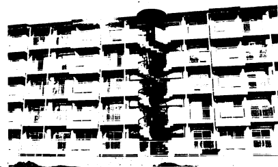
ゆとりの3LDK元町住宅