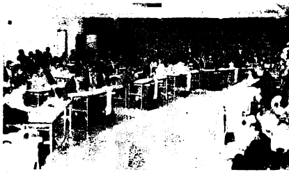
知事との対話集会のもよう

県主催による知事と県民との対話集会が、10月17日午後1時から鳥栖基山農協会館で開かれました。鳥栖市および三養基郡の5町村の各階層から83人(市から15人)が参加。まず香月知事が「対