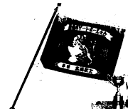
寄贈された優勝旗とカップ