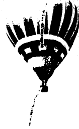
秋空に上がった熱気球

館、農業広場での米まつり、スポーツ広場での熱気球上げおよび土佐大全国大会などが人気を集めていました。期間中の入場者は約13万人だったそうです。