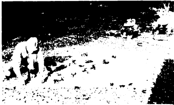
とりいれに2日かかります

散り敷く「ぎんなん」、ツンとくる独特のにおい。10月8日、市の重要文化財・西清寺のいちよう(田代上町)の実のとりいれがありました。