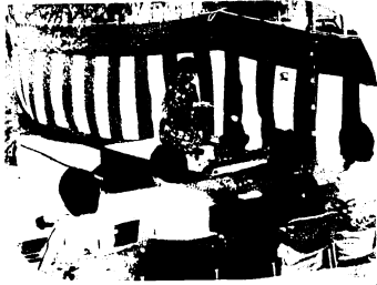
おごそかに野だての茶会

市と市文化連盟主催の第18回市民文化祭は、10月28日から11月4日まで行われ、茶会、合同文化展、謡曲大会および芸能祭など多彩な催しを多数のみなさんが楽しみました。