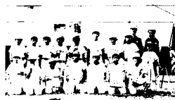
優勝した旭Aチーム