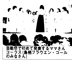
芸能祭で初めて発表するママさんコーラス(鳥栖アラウエン・コールのみなさん)