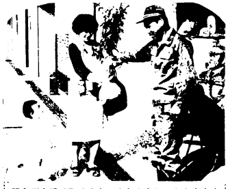
記念樹を受け取る赤ちゃんとやさしいおかあさん