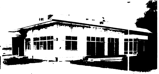
南老人福祉センター (☎③0024)