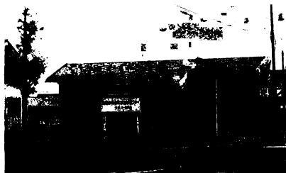
完成した休日救急医療センター