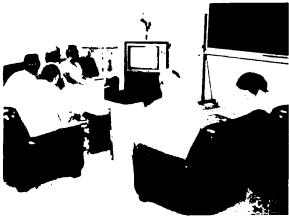
鳥栖南老人福祉センターが開館