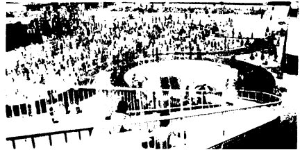
市民プールが7月1日にオープン（期間中の利用者は5万2964人）