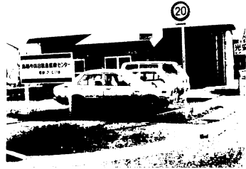
休日救急医療センター開設（初日の来診者は36人）