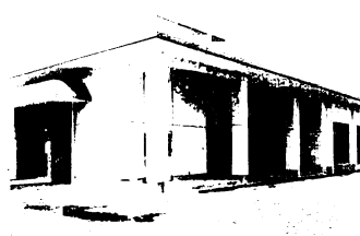
農家高齢者創作館を今泉町に建設