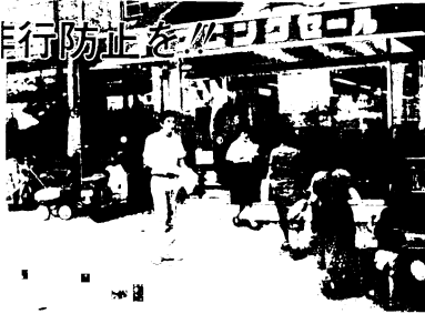
街頭でのチラシ配布

みんなで見守って行 きましよう。 ▶非行防止の かめは家庭!! ▶有害環境の 浄化は住民運動で!!