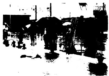
雨の中での実技指導のまよう

講習会には、各町区の子供クラブ指導者や小中学校のPTA役員、保母さんなど約50人が参加。日本赤十字社佐賀県支部の原口救護係長などから