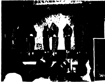
(上) 第3回基里地区文化祭の日本舞踊発表会