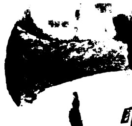
(上) 2月22日に出土した石戈 (右) 大正2年に安永田遺跡から発見された銅戈

されています。中広形銅戈以降はやはり銅鐸と同じように祭祀(さいし)品として埋納されるようになってきます。