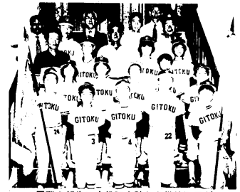
優勝の報告に市役所を訪れた儀徳町子どもクラブチームのみなさん

また、市の予選会は8月17日麓小グラウンドで、各地区代表6チームが参加して行われました。なお、試合の結果は次のとおりです。