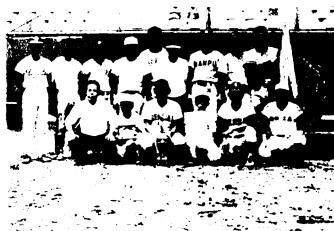
みごとに2年連続優勝した今泉町チーム

〔第1回戦〕儀徳町19対3 轟木町、藤木町15対13 曾根崎町(準決勝) 儀徳町5対3 山浦団地、藤木町14対2 古賀団地(決勝) 儀徳町11対2 藤木町。