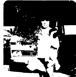
人生記念樹を受け取る親子