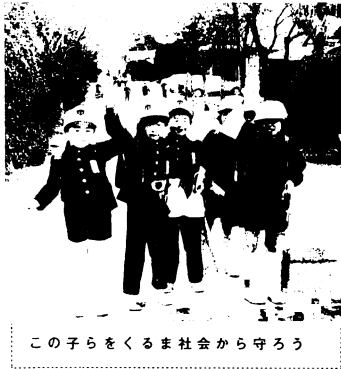
この子らをくま社会から守ろう

県・市交通対策協議会は、「歩行者、とくに新入学(園)児を中心とした子供の事故防止」「自転車の安全利用の促進」「二輪車の前照灯昼間点灯運動の推進」「安全運転管理の充実と安全運転の確保」の4つのことを今年の運動重点目標として運動を展開します。市民みなさんのご理解とご協力をお願いします。