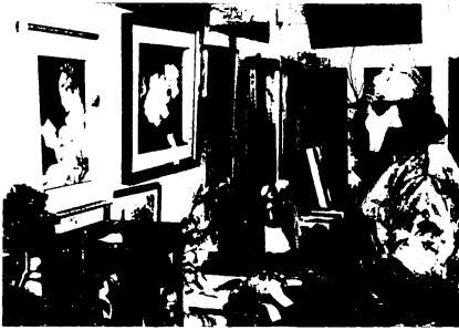
旭地区文化祭の作品展会場

地区民移参加の第1回旭地区文化祭が、昨年4月に開館した旭公民館で、3月8日と9日に