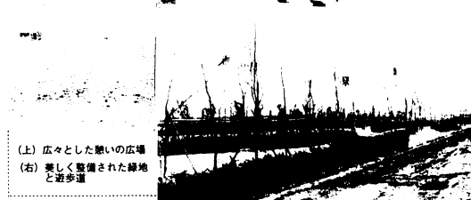
(上) 広々とした憩いの広場 (右) 美しく整備された緑地と遊歩道

市は、商工団地周辺の環境整備と公害の緩和のため総事業費約7000万円です。昨年12月から、約3㉿の緑地園路広場工事を行