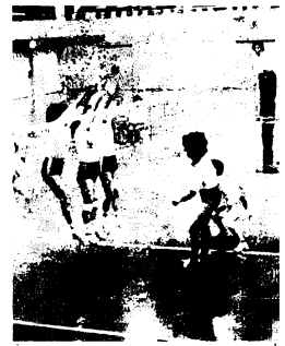
婦人の部の決勝戦のよう

なお、大熱戦の結果は次のとおりです。 〈一般男子〉1位:鳥栖市役所 2位:基山クラブ 3位:三田川クラブ、目達原