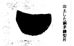
出土した銅矛鑄型片

申込み 12月3日(水)までに参加費用を添えて市教委社会体育課へお申込みください。