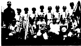
初優勝した加藤田町Aチーム