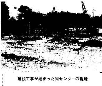
建設工事が始まった同センターの現地

市は鳥栖南老人福祉センターにつづいて5番目の老人福祉センターとして、このほど田代老人福祉センターの建設工事に着手しました。