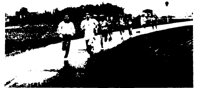
職域対抗駅伝で力走する選手

2位:北九州コカ・コーラボトリング(1時間7分51秒) 3位:九州瀬水A(1時間8分53秒) 4位:大石書齋堂(1時間11分58秒) 5位:鳥栖三養基地区消防署(1時間12分14秒)