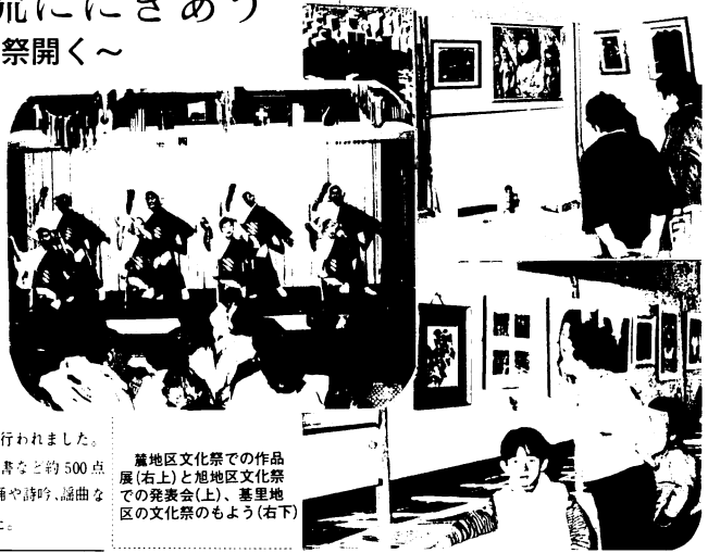
麓地区文化祭での作品展(右上)と旭地区文化祭での発表会(上)、基里地区の文化祭のよう(右下)

基里地区文化祭は、2月14日から16日まで同公民館と同老人福祉センターで、第4回目が行われました。作品展には手芸や写真、書など約500点の作品が出品。発表会では、舞踊や詩吟、謡曲など約170人が発表しました。