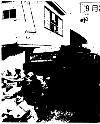
ゴミ収集も今年から、週2回(年間)行っています