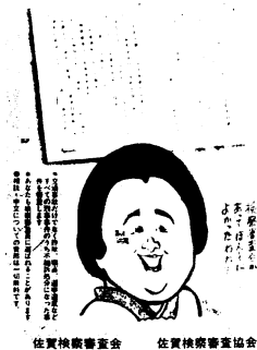
佐賀検察審査会 佐賀検察審査協会