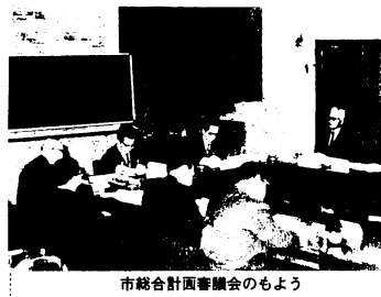
市総合計画審議会のまよう