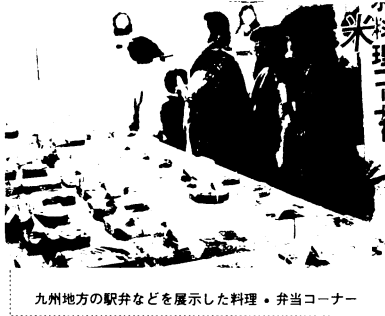
九州地方の駅弁などを展示した料理・弁当コーナー

同協議会は、会長の助役と福祉事務所長ら関係課長12人で構成、事務局を市福祉事務所に置き、身障者の社会参加の推進や記念事業の開催などに取り組んでいきます。