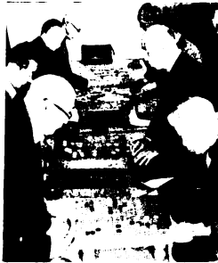
静かな熱戦の老人囲碁将棋大会