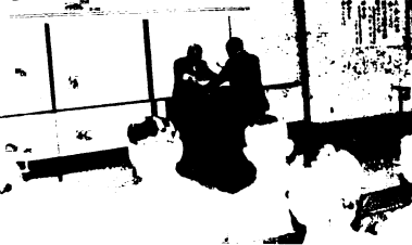
防犯運動推進鳥栖地区大会のもよう