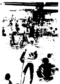
親子トリム教室のもよう

なお、トリムとは、ノルウェーの船舶用語で、船の前後左右に荷物を積んで船のバランスをとる意味をもじって、身体で「健康と心」のバランスをとることが、体力づくりにつながることから、体力づくりの用語として用いられています。