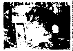
立石町にある「鬼の爪跡石」

ようです。地名は「場所を示す、標記であると同時に、古い時代の記憶を保存している歴史の資料でもあり、また、私たちの先祖が農業として自然に働きかける際、その土地の性格や状態を示す「言葉、なのです。さて、昔から平田町の天満宮付近一帯に