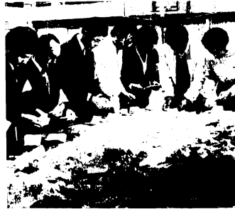
市議選は市民体育館でいっせいに即日開票