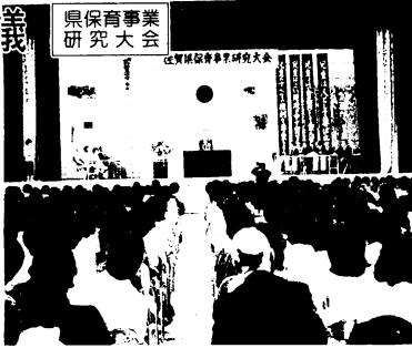
第23回県保育事業研究大会のもよう

現在、県内には公私立を含めて214の認可保育所があり、核家族化の進行や夫婦共働きの増加などで保育所も毎年5、6か所ずつ新設されてきています。