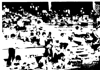
スタンドで鉛筆をふるう親子