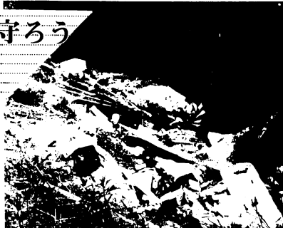
山の中に不法投棄されたゴミ

6月5日から11日まで、環境週間です。わたしたちの家庭から出るゴミの量は、年々増える一方で、いまや「ゴミ戦争」といわれるほどで、膨大なゴミの量と処理費用の増大は財政的にも深刻化する一方で、また、山や海などの自然も、ゴミ公害に泣いています。レジャーを楽しむ人たちのマナーの悪さが、貴重な自然を痛めているのです。ゴミ公害からわたしたちの環境を守ろう——よりよい環境を求めて一人一人が気をつけましょう。