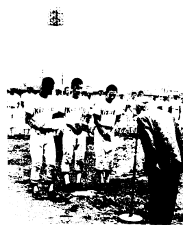
表彰される基里中チーム

なお、試合の経過は次のとおりです。<第1回戦>鳥栖西3対1鳥栖、基里1対0田代<決勝戦>基里3対2鳥栖西