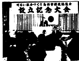
明社市推協設立記念大会のもよう

同協議会には、各地区婦人連絡協議会や（社）鳥栖青年会議所、市子どもクラブ連合会など41団体が加盟。今年は清掃奉仕の活動や献血活動（7月）、家庭教育講演会（9月）などの行事に取り組まれます。