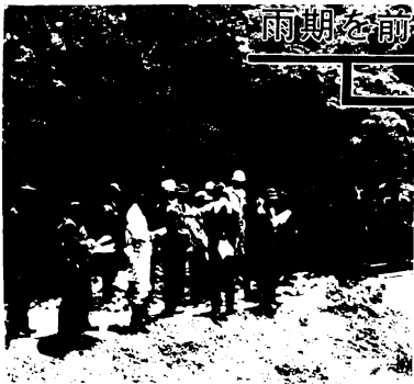
原古賀ため池を現地視察する “防災パトロール”の一行