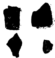
発掘された1・2・3・4個目の銅鐸鋳型(右の写真)と5個目鋳型の出土状態(左の写真)