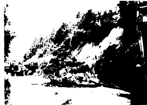
川久保線が丘のがけくずれ