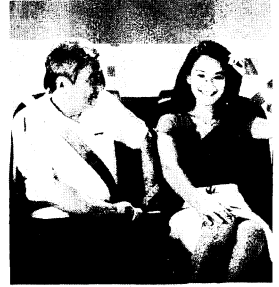
となりのあなたへ 思いやり。

ないで運転しています。車に乗る方は、シートベルトの着用こそ安全のパスワード、を合言葉に、安全運転を心がけましょう。