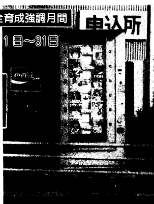
悪書を追放しましょう(現在、市内7か所に悪書自動販売機があります)

市青少年育成会(豊壇内区会長ほか27人)は、2月12日市役所会議室で会議を開き、地区・街区青少年育成の組織づくり(鳥栖北小・田代小・旭小校区は56年度中に組織される)や地域ぐるみの環境浄化活動、広報・啓発活動などの推進を57年度の運動重点目標に決めました。