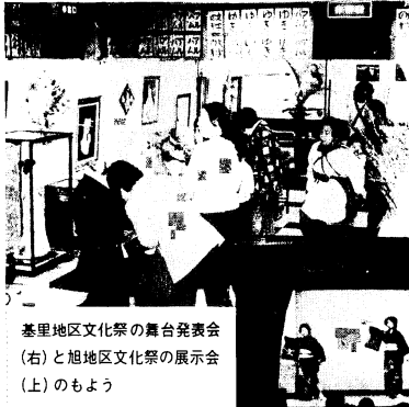
基里地区文化祭の舞台発表会 (右)と旭地区文化祭の展示会 (上)のもよう