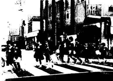
待ちましようはらはらときどき渡るより