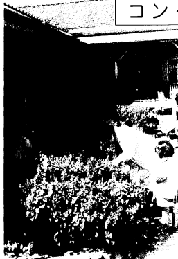
▲会長賞を受けた小鳩園の花壇