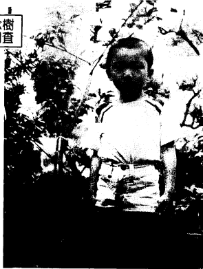
僕も記念樹もこんなに大きくなりました (52年10月に配布)