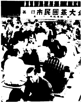
会場いっばいに静かな戦いを展開

第11回市民囲碁大会(日本棋院鳥栖支部主催)は、4月25日中央公民館で行われ、A組(有段者)で宿町チーム、B組(1～4級)でP L鳥栖チーム、C組(5～8級)とD組(9～12級)でエタニットパイプチームがそれぞれ優勝しました。おめでとうございます。 この大会には、市内の事業所や地域の囲碁愛好グループなど40チームが参加。静かな熱戦を会場いっばいに展開しました。こうした