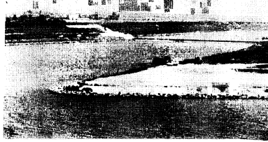
新宝満川が筑後川にそそぐ

▲河川や水路などで、無断で砂を取ったり、橋を架けたり、土管などを埋めたりしない。