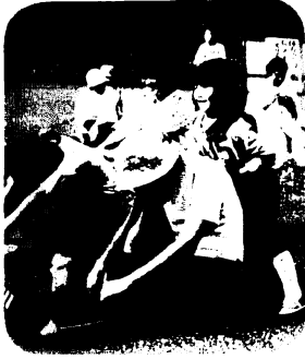
▲家族で楽しく体力づくりを

なお、49年に市交対協会会長、55年には市政功労賞を受けられています。これらも元気で、交通安全のために活躍をお願いします。