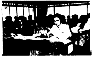
▲熱心に研修を受ける主婦のみなさん

水質汚濁は、工場や事業場、一般家庭などから多量の有害物質や汚濁物質が排出されるために、飲料水などに障害を生じたり、生態系や自然の景観などが損われる現象をいいます。