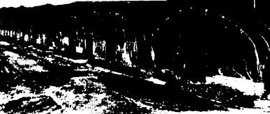
▲アスパラガスの集団栽培ハウス（袖比）