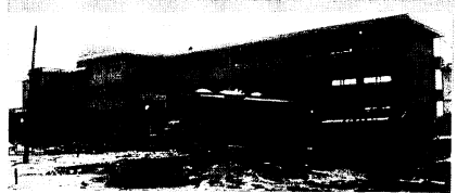
▲工事がすすむ田代中学校

●旭小学校校舎建設に着手 60年4月開校を目標に、本年度から校舎建設に着手します。建設規模は25学級で、鉄筋コンクリート3階建ての教室棟と給食室 6,020