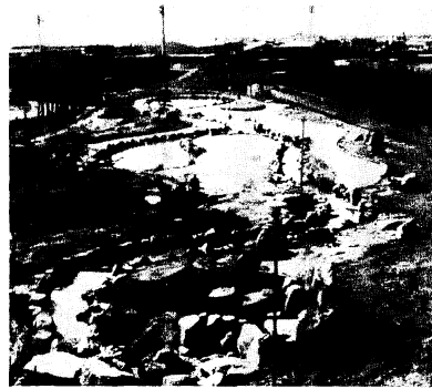
▲市民公園内の日本庭園工事

●58年度テクノポリス地域指定めざす 通産省は、本年度に各地域の開発構想の内容や地域の熟度などを考えあわせ、事業計画の承認を認めます。そこで久留米・鳥栖地域が県と一体となって、本年度にテクノポリス建設候補地として地域指定されることを目標に、開発構想の策定を進めています。