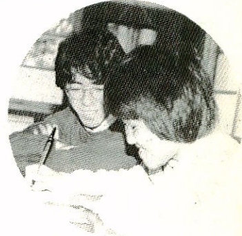
▲ボランティアの青年も協力