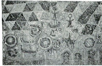
▲田代太田古墳の壁画模写絵

(東町2丁目☎③5038)へ。ただし、午後5時以降と日曜日、祝日は次の当番店へお申し込みください。