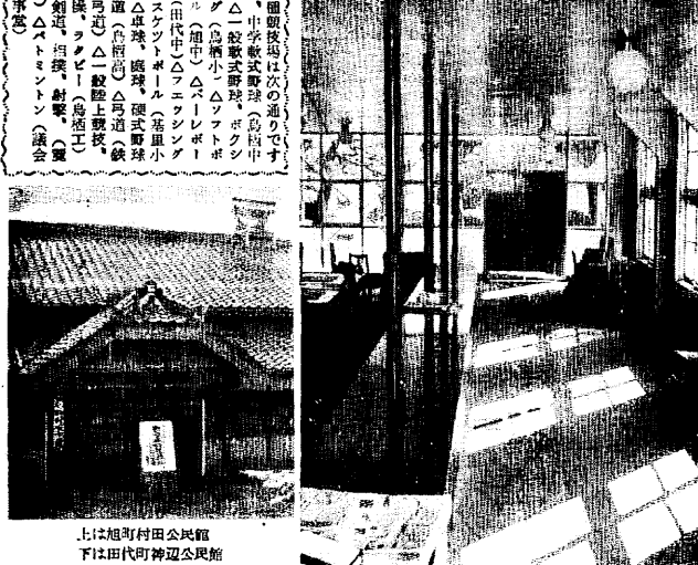
上は旭町村田公民館 下は田代町神辺公民館

△定例市議会 十一月十四日開会 会期十日間の予定 主なる議案の内容 ▼田代町村の決算認定 ▼田代町村の決算認定 ▼田代町村の決算認定