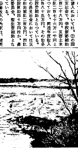
写真は鳥居市立学校の着工現場。向つて右...