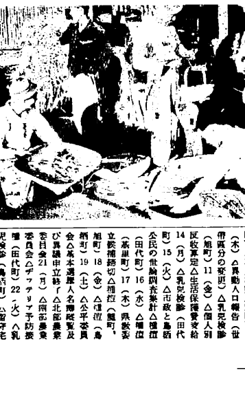
(写真は坪刈りの結果を調べるグループ)