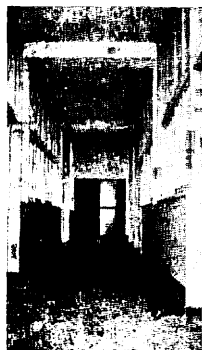
(下) やがて新築成る日も近い中央公民館