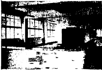
左上 庁舎全貌 左下 建設現場となる十五階の和室