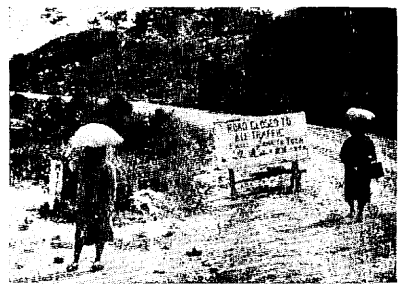
(写真上) 広い道路を高級車が疾走する沖繩の市街 (写真下) 荷物を頭に集せて買物婦りの主婦