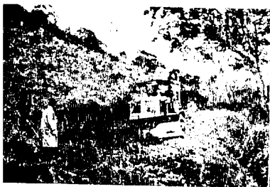
写真左 朝日山登山口一御野立折間 約五百メートルの登山道が関係者の協力で幅四メートルになった。