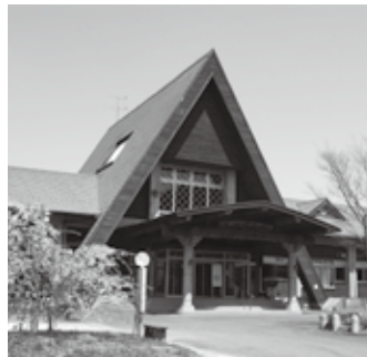
とりごえ温泉 栖の宿