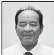
農業共済組合推薦