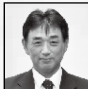
農業協同組合推薦