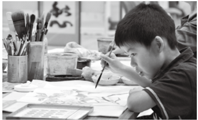
◆子どもたちの真剣なまなざしが 見られた体験コーナー

また、3日には、おなじみ「とっとちゃん」や「ウイントス」をはじめ、県内各地から7体のゆるキャラが大集合する「ゆるキャラまつり」が行われ、文化祭に華を添えました。ゆるキャラたちが1体ずつ登場すると、子どもたちが歓声をあげて駆け寄り、キャラクターとふれあったり記念写真を撮ったりして楽しみました。