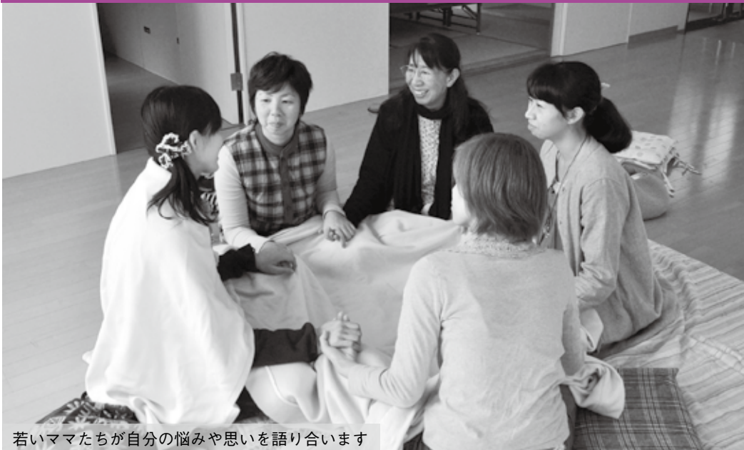
若いママたちが自分の悩みや思いを語り合います