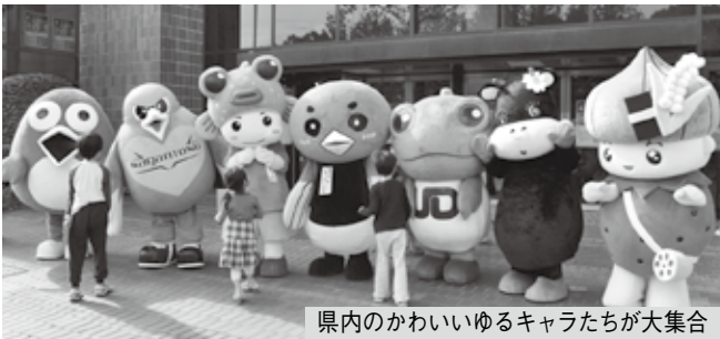
県内のかわいいゆるキャラたちが大集合