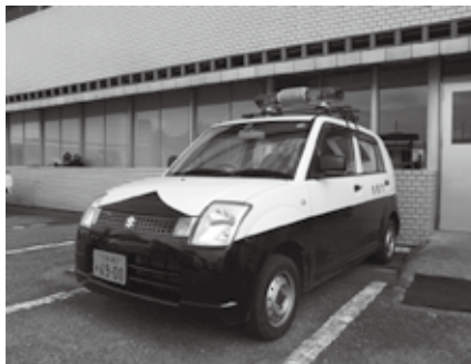
不法投棄防犯パトロール車

また、9月中旬から10月中旬の「不法投棄防止強化月間」にあわせて、市内8町区を各地区の県不法投棄監視員と同行して不法投棄多発地点のパトロールと意見交換を行いました。