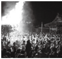
勢いよく燃え上がる炎

とき ● 1月7日(土) (大松明点火=21時ころ) ところ ● 大善寺玉垂宮 (久留米市大善寺町) 問い合わせ ● 大善寺玉垂宮 (☎27-1887)