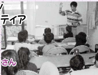
ふれあい絵画教室の様子

「NPO法人全力疾走」は、何事にも全力で取り組むことを目的に、平成23年8月に誕生しました。「障がい者にも出来ることはたくさんある」をモットーに、いろいろな仕事を通して、働きたい障害者を支援・応援しています。