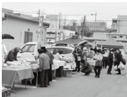
お気に入りの一品が見つかるかも…

■問い合わせ 夢プラン21実行委員会事務局(市民協働推進課内) ☎85-3576)