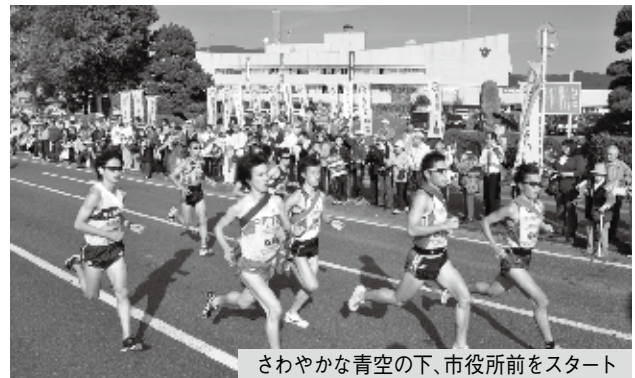
さわやかな青空の下、市役所前をスタート

グランツール九州2011の第3ステージが鳥栖市役所前をスタート地点に開催され、各県を代表するランナーたちが、鳥栖の街を駆け抜けました。