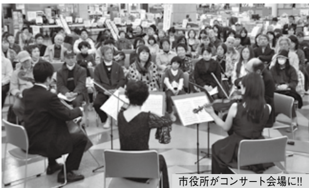
市役所がコンサート会場に!!