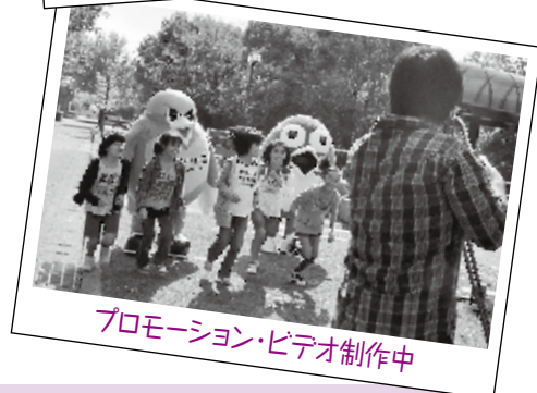
プロモーション・ビデオ制作中