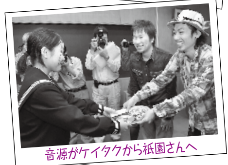
音源がケイタクから祇園さんへ