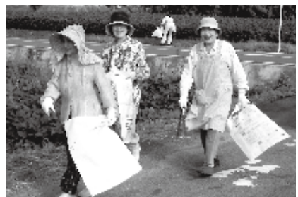
江寿クラブのごみ拾い