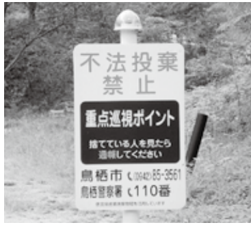
不法投棄防止看板