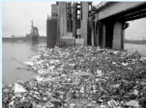
きれいな河川を守るためにも、皆さんの協力をお願いします