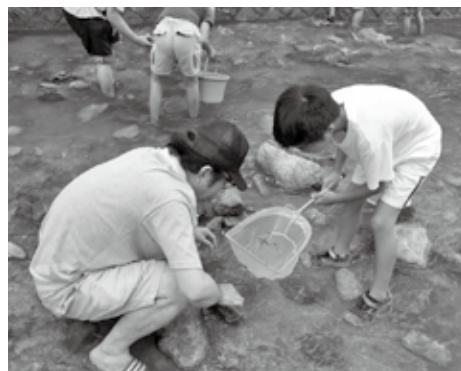
親子で楽しい思い出を作りませんか