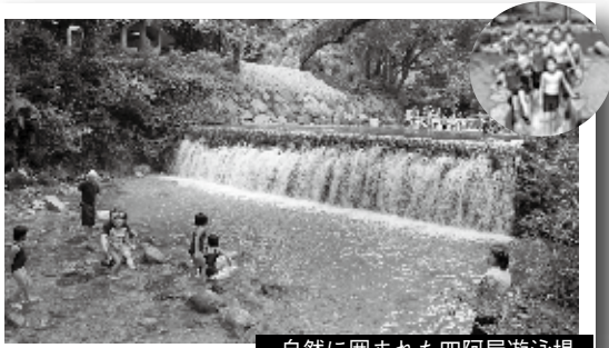
自然に囲まれた四阿屋遊泳場

市は、夏休み期間中の7月21日(土)から8月31日(金)まで河川プールを開設します。 清らかな川の水を利用したプールへ出掛けませんか。