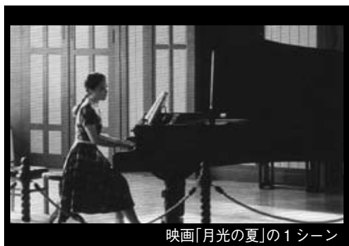
映画「月光の夏」の1シーン