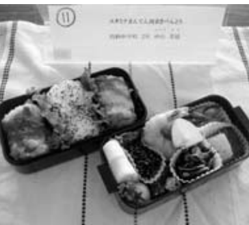
昨年の優勝作品のお弁当