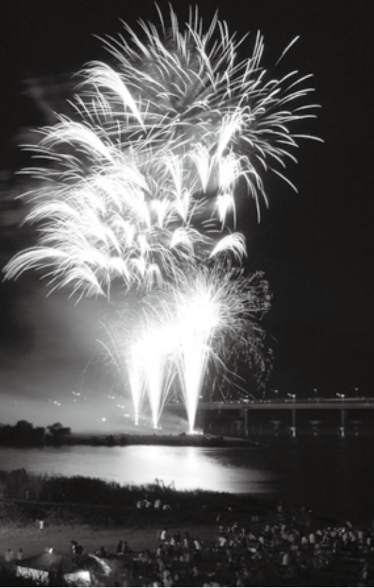
絶好のロケーションで花火を楽しむことができます