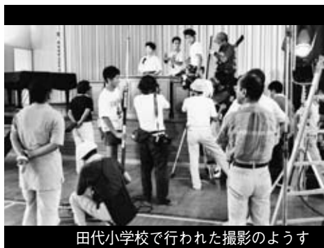
田代小学校で行われた撮影の様子