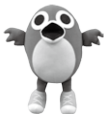
写真は「とっとちゃんぬいぐるみ」

鳥栖市のイメージキャラクター「とっとちゃん」のグッズを発売しています。あなたもとっとちゃんグッズを集めてみませんか。