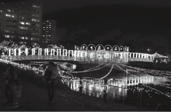
幻想的な光の世界に包まれます(昨年のような)