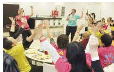
笑いヨガの伝道師を迎えてのわくわく秋祭りを楽しもう会