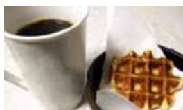
おいしいスイーツもご準備しています(写真はイメージ)

好評のマネーセミナーを2月28日に開催。将来のためのお金に対する不安や疑問がある女性はぜひ参加を。時間と金利の関係や、定額積立の仕組みを、分かりやすく解説します。 「効率的で賢いお金の貯め方」を学べば、10年後20年後の貯蓄額に大きな差が出ますよ! 住所/熊本市西区春日5丁目1-11 ☎06(44)7588