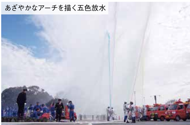
あざやかなアーチを描く五色放水

消防ポンプ自動車などによる五色放水では、市民が見守る中、色とりどりの水のアーチが勢いよく空に放たれ、式を盛り上げました。