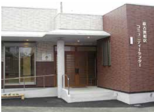
宝くじの社会貢献広報事業(コミュニティ助成事業)の助成を受け、バリアフリー化など大規模改修が完了した原古賀町区コミュニティセンター