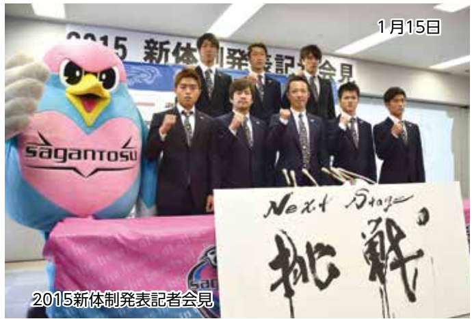
2015新体制発表記者会見

2014シーズンを5位で終えたサガン鳥栖。J1リーグ戦4年目に挑む今季の開幕戦は、3月7日(土)14時からホーム・ベストアメニティスタジアムで、昨シーズン12位のアルビレックス新潟と対戦します。