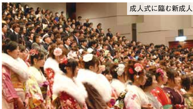
成人式に臨む新成人

式典終了後の第二部の記念行事では、恩師からのビデオレターや家族へのメッセージなどを実行委員会が企画。新成人は、成人を迎えたことの喜びを分かち合い、大いに盛り上がりました。