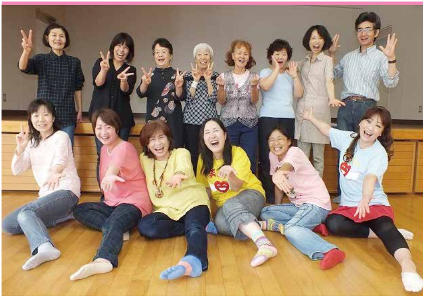
笑って健康!明るく元気いっぱいの鳥栖笑いヨガクラブの皆さん