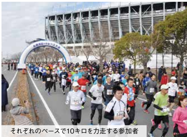
それぞれのペースで10キロを力走する参加者