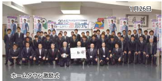
ホームタウン激励式

開幕戦3.7(土) 14:00 ベストアメニティスタジアム サガン鳥栖 VS アルビレックス新潟