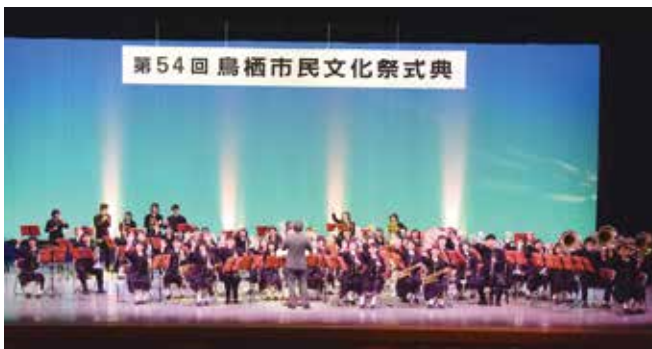
鳥栖商業高等学校吹奏楽部の皆さんが式典に華を添えました

式典では、市政功労者や芸術文化賞などの表彰が行われたほか、鳥栖商業高等学校吹奏楽部が演奏を披露し、会場を盛り上げました。文化祭は、舞台発表や作品展示、物産展など盛りだくさんの内容で、特別企画として鳥栖市民劇団による「駅前食堂物語」も上演されました。