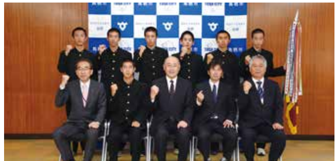
全国大会に出場する鳥栖工業高等学校駅伝部の皆さん

同駅伝部は、佐賀県高等学校駅伝競走大会で優勝し、6年連続40回目となる全国大会出場を決めました。選手たちは今年も念願の入賞を狙って都大路を駆け抜けます。