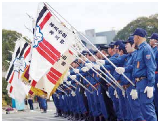
市中パレードコース

出初式の開催に伴い市役所南側駐車場は、1月9日(土)の午後から駐車禁止となりますので、ご協力をお願いします。