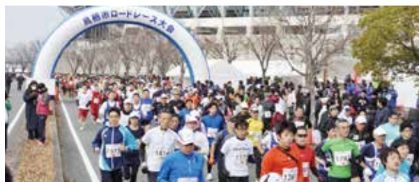
「鳥栖市ロードレース大会」交通規制

10時40分(同50分) = 10キロコース(同スタジアム南ゲート交差点~高田町~同スタジアム東ゲート前)