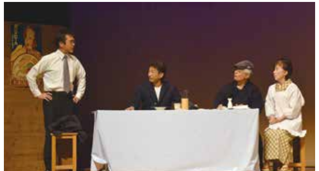
▲駅前食堂物語は、60年前の鳥栖駅前の食堂のある一日が描かれ、好評につき今回再演されました