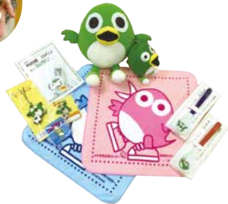
▲とっとちゃんグッズは新鳥栖駅観光案内所で販売しています