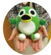
◀新発売のとっとちゃんぬいぐるみ(税込1,000円)

また、同案内所では、市内の観光情報やお土産品の紹介などもしています。とっとちゃんグッズは、ぬいぐるみの他、ストラップやピンバッジなどもあります。詳しくは同案内所へ。