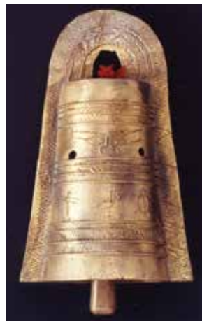
安永田遺跡出土鋳型より復元した銅鐸

を奏できます。使用用途は不明ですが、宗教的な行事に奏でられたものではないかと想像されています。除夜の鐘のような荘厳な音を当時響かせていたので(鳥栖市誌第2巻第2編第2章より)