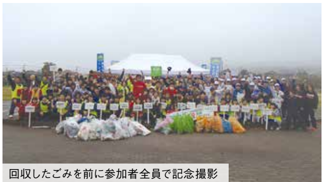
回収したごみを前に参加者全員で記念撮影

同大会は、ごみの量と質をポイントに換算して競い、割れた瓦や電気ポットなど20kgを超えるごみを集めたチームもあり、全体で143kgのごみを収集しました。