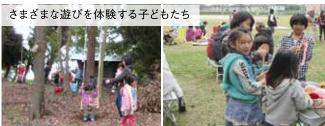
さまざまな遊びを体験する子どもたち

この取り組みは、「外遊び」を通して子どもが地域の中で自ら育つ環境づくりをしようと市民団体「team. 遊悠融」が企画し、県のさが段階チャレンジ交付金事業の支援を受けて開催されました。参加した子どもたちは、小枝や割り箸を使った工作や紙飛行機飛ばし、拾った落ち葉やどんぐりでのままごと、木にロープを吊るした遊びなど、日頃できにくくなった自由な遊びを体験しました。