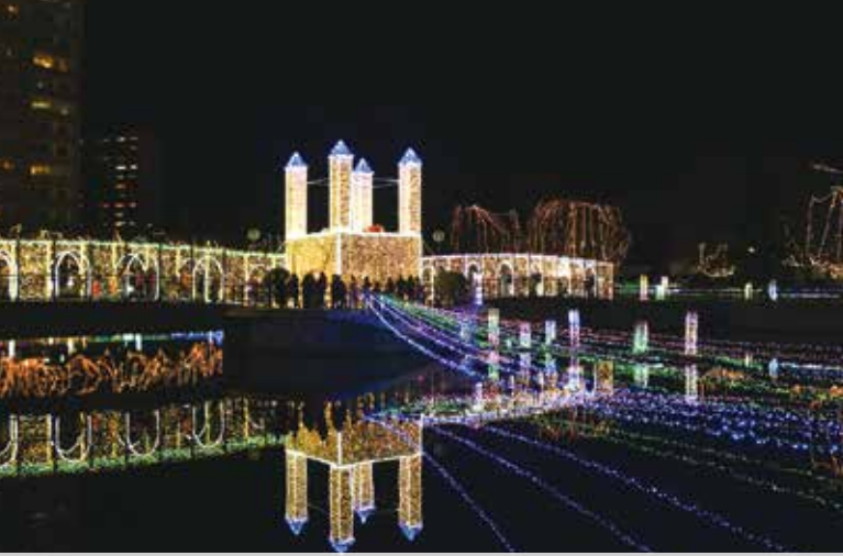
東屋から橋までをお城に見立て約3万9000個のLED電球で装飾しています