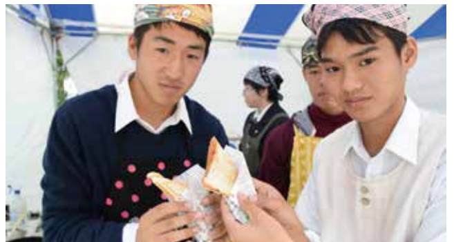
▲鳥栖商業生が授業の一環でご当地グルメ「とりこどん」を商品開発し、ホットサンド「とりこさんど」として販売しました